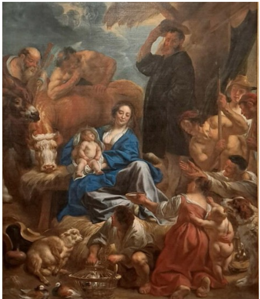
L'Adoration des bergers : Jacob Jordaens

L'incarnation du Sauveur en agneau remonte aux débuts du Christianisme. On rencontre des figurations sur les murs des catacombes datant de la fin du 2ème siècle. Dans les églises romanes, l'agneau prend le pas sur le poisson secrètement utilisé par les premiers chrétiens, car poisson en grec est l'anagramme de Jesus Christ, fils de Dieu Sauveur.