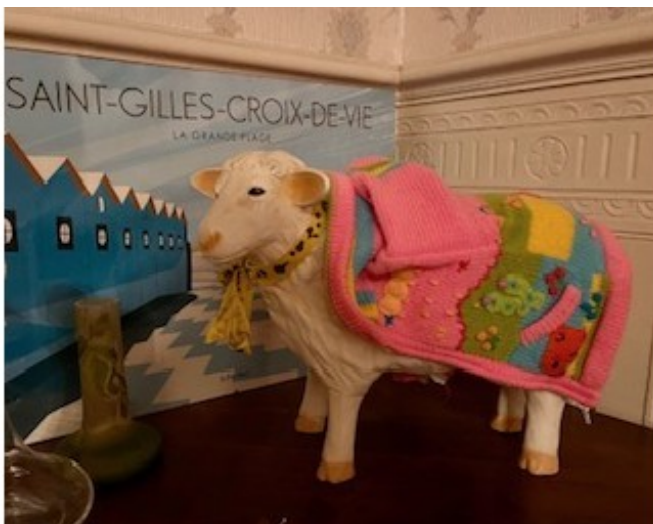
Sculpture de mouton, avec sa « petite laine » de mouton évidemment !!!

Le mouton s 'introduit jusque dans nos maisons :