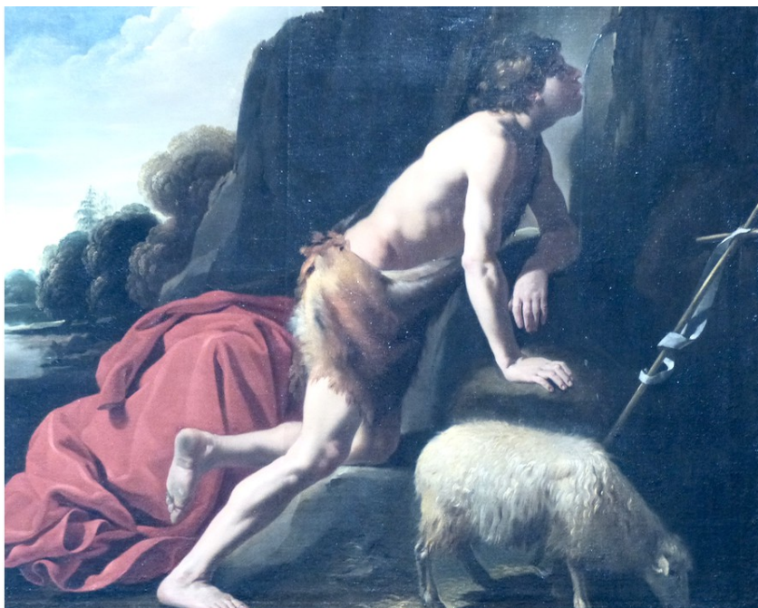
Johannes Moreelse : Saint Jean-Baptiste à la source

Mouton d'or c'est le nom d'une ancienne monnaie de France avec d'un côté l'image de St Jean Baptiste et de l'autre celle d'un agneau « ecce agnus dei... (l'évangile selon St Jean : il écrit à propos de Jean Baptiste « voyant Jesus venant à lui : voici l'agneau qui enlève le pêché du monde »