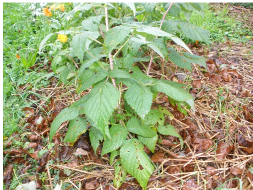
Framboisier avec paille de blé

Le paillage est à renouveler tous les ans, et toujours avec au moins 7 cm d'épaisseur.