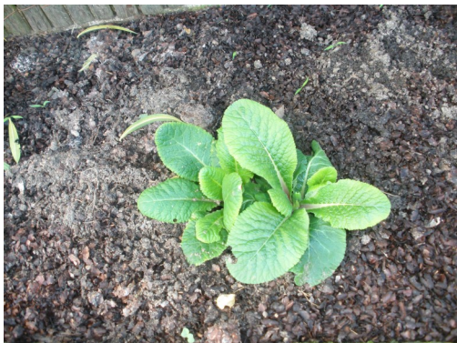
Primevère et coques de cacao